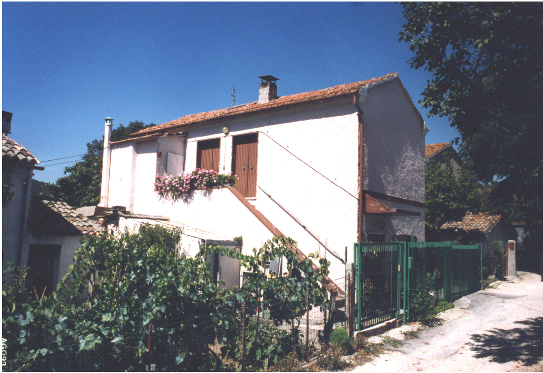
II° metà del XIX secolo