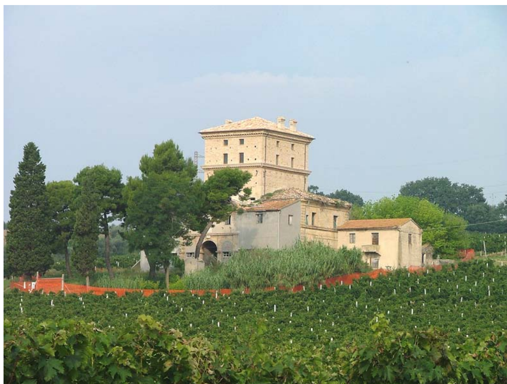
SITUAZIONE ATTUALE – FOTO ANNO 2005