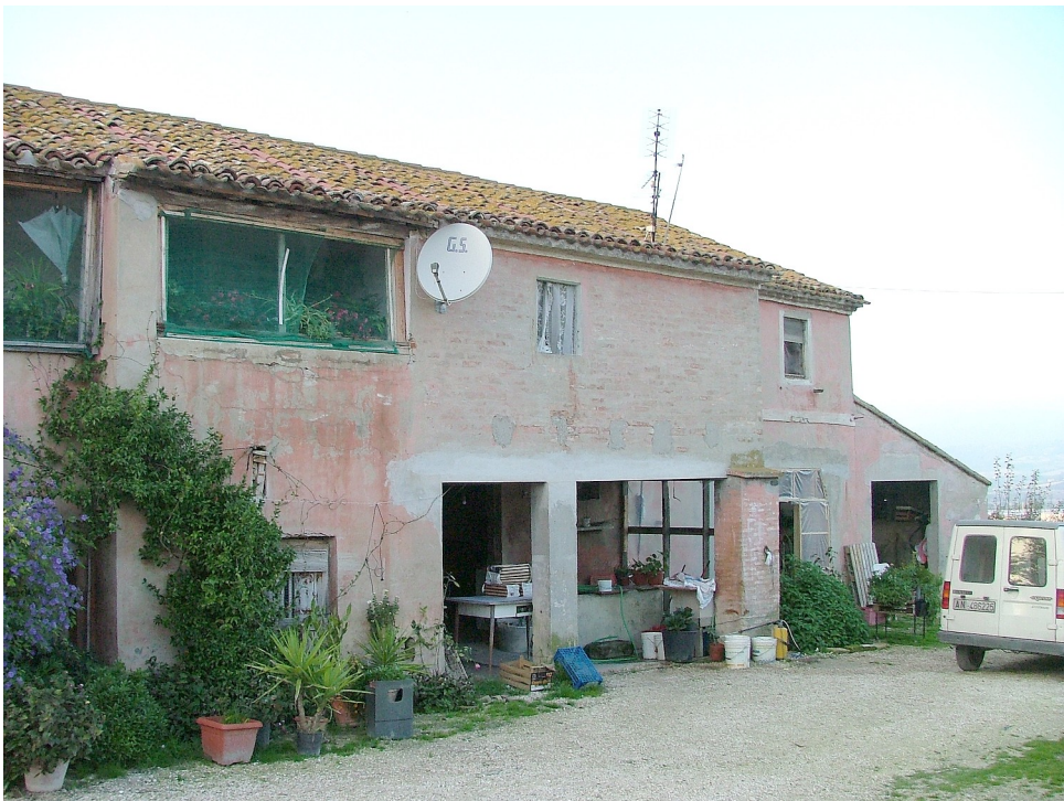
SITUAZIONE PRECEDENTE – FOTO SCHEDA ANNO 2005