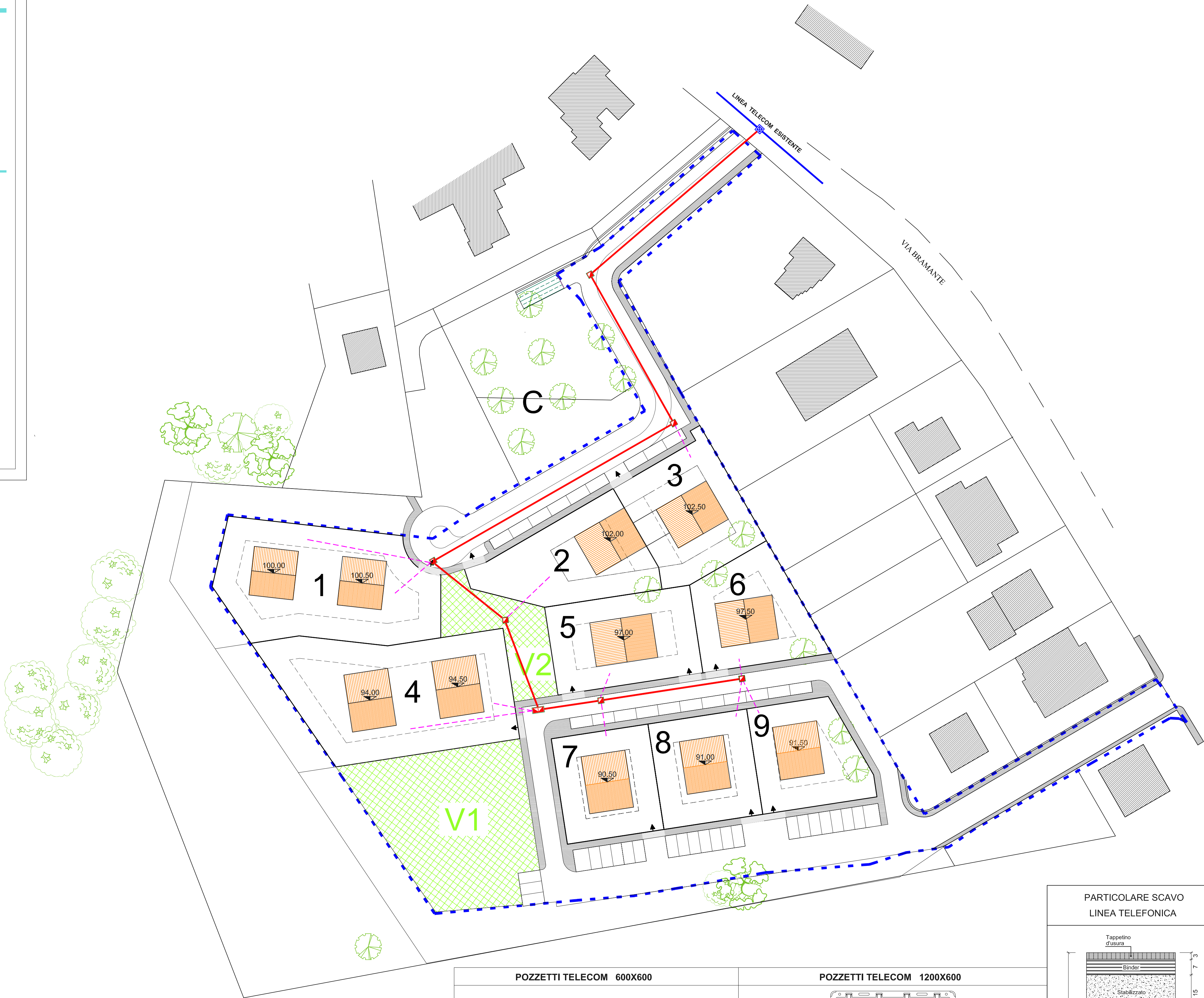
POZZETTI TELECOM 600X600