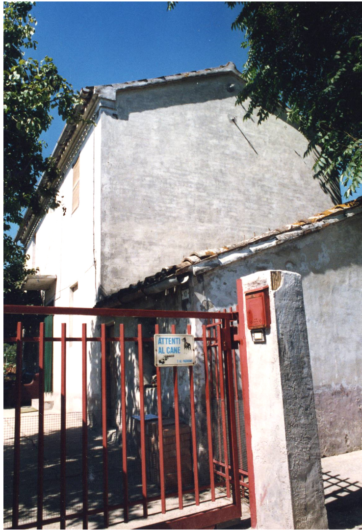
II° metà del XIX secolo