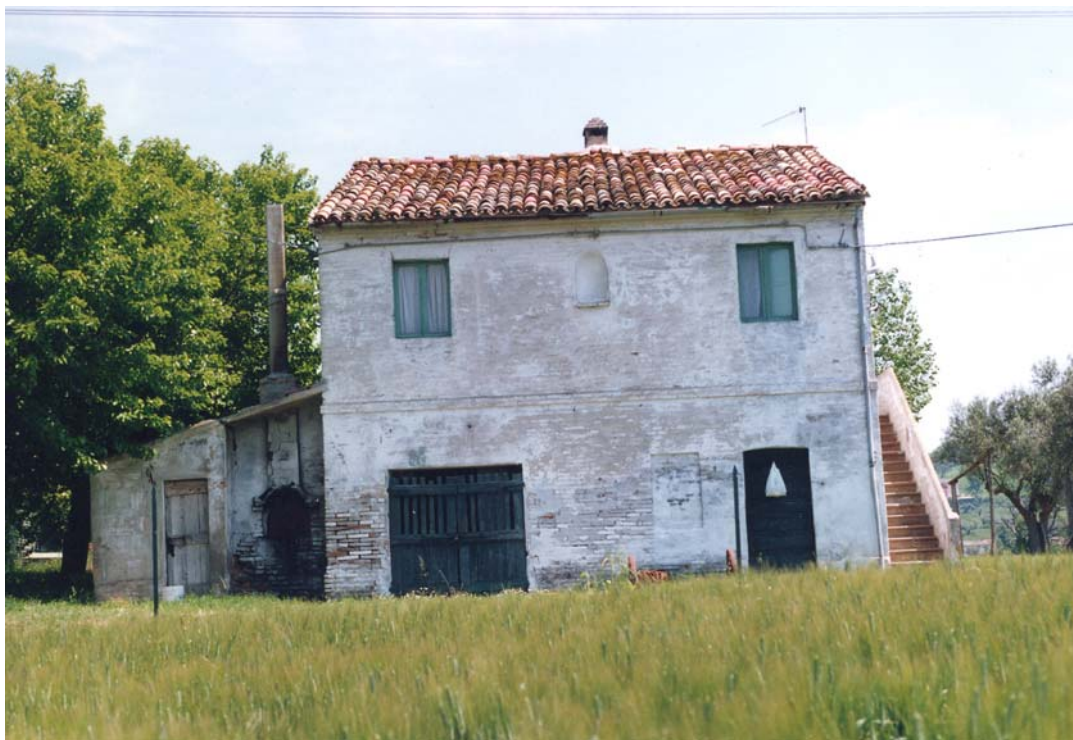
SITUAZIONE PRECEDENTE – FOTO SCHEDA ANNO 1991