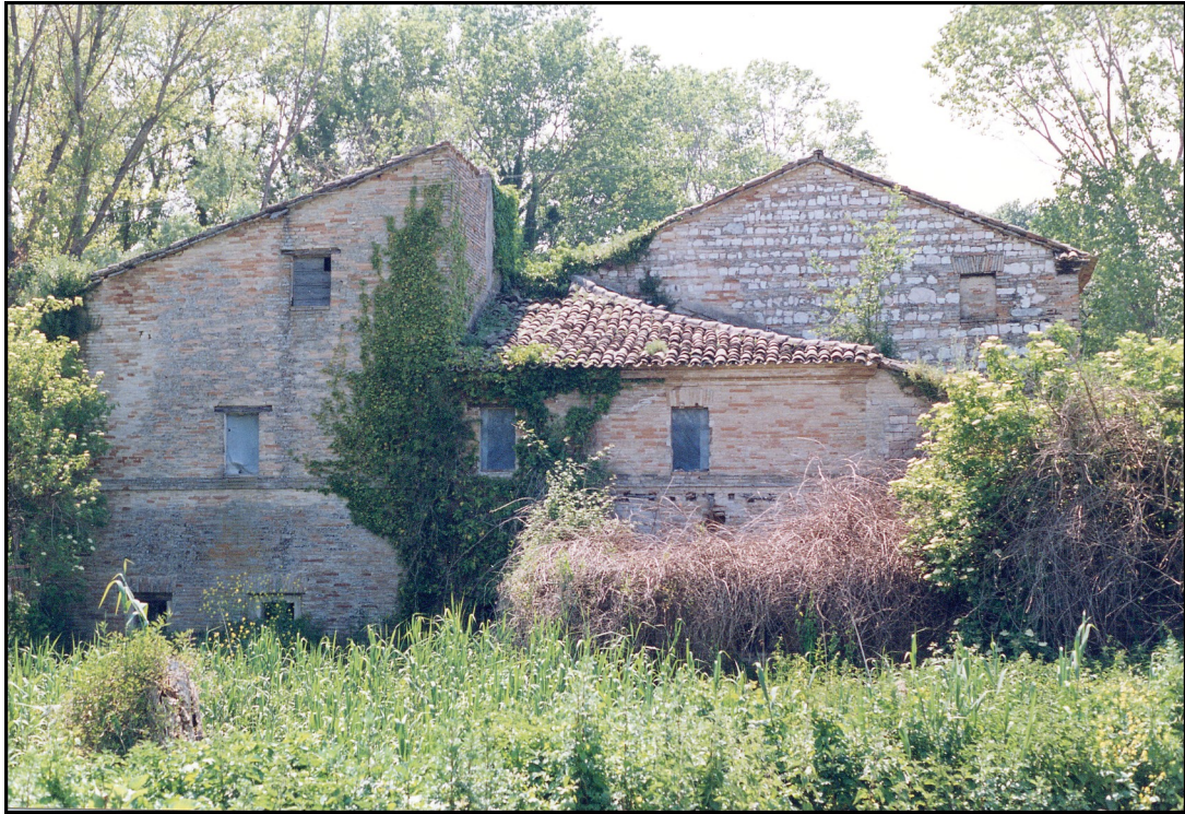
anteriore al 1800