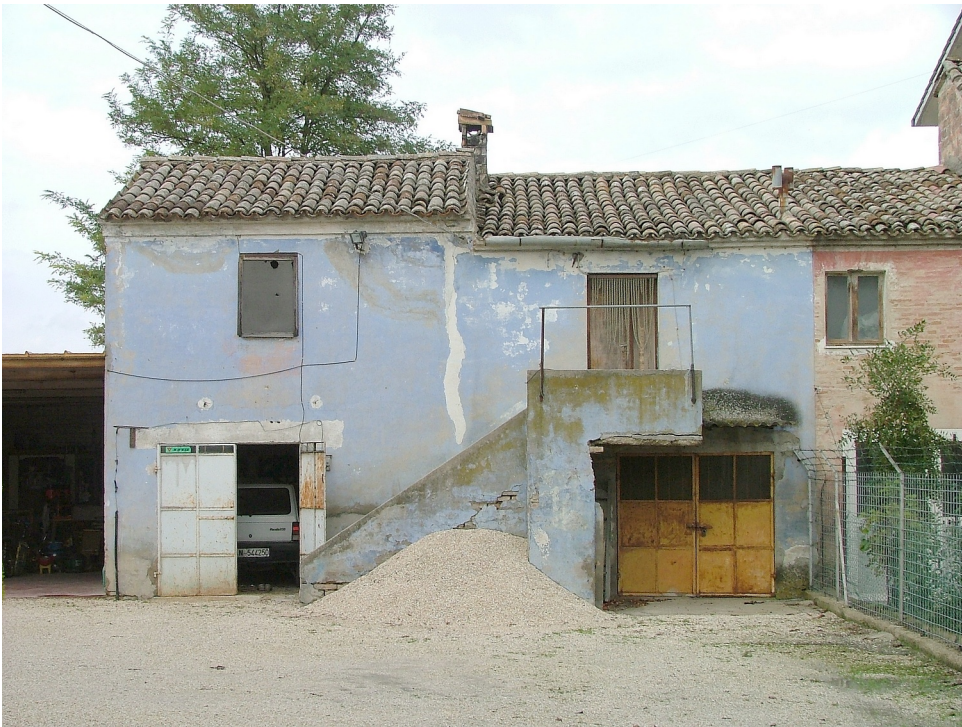
SITUAZIONE PRECEDENTE – FOTO SCHEDA ANNO 2005