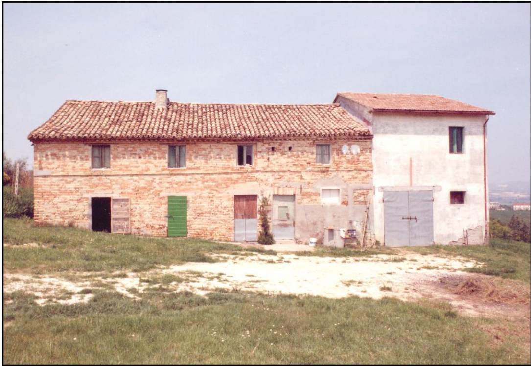
anteriore al 1800