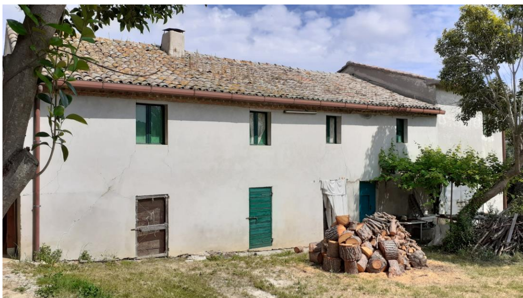
SITUAZIONE ATTUALE – FOTO ANNO 2023

EPOCA: anteriore al 1800 successiva al 1865