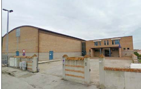
Elementari Fornaci Via Rossini, 137 260 + 195 posti al coperto serviti da allestire nell'atrio un locale refettorio