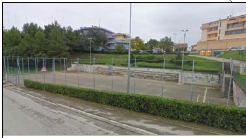
Area attesa Via Delle Sgogge