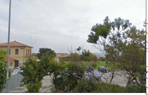
Via Lumumba, 7 Posto medico avanzato - Croce Verde