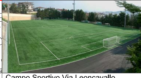
Campo Sportivo Via Leoncavallo 1320 posti in tenda serviti