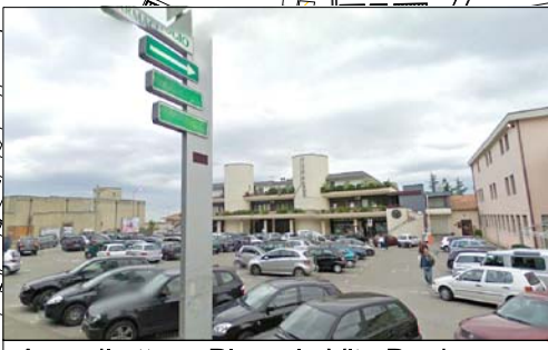
Area di attesa Piazzale Vito Pardo