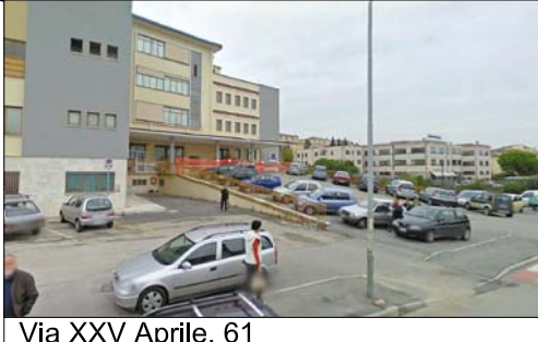
Via XXV Aprile, 61 Posto medico avanzato - R.S.A.