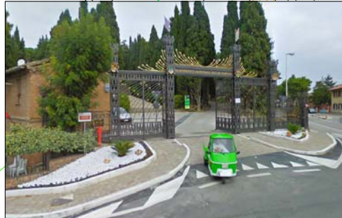
Area attesa Matteotti