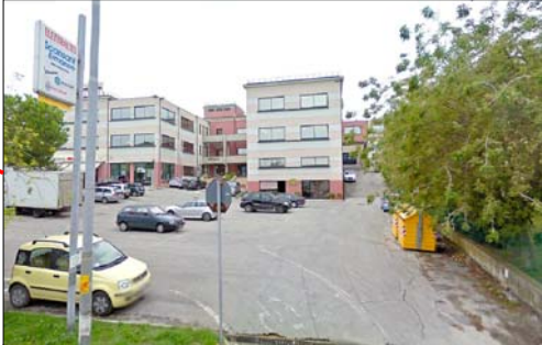
Area attesa Via XXV Aprile