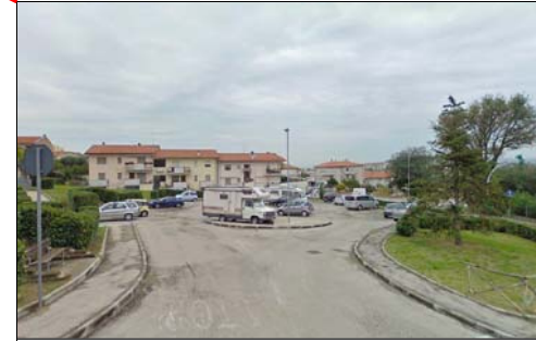
Area attesa Via Rossini