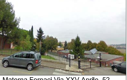
Materna Fornaci Via XXV Aprile, 52 90 posti al coperto serviti + 180 in tenda da allestire nell'atrio un locale refettorio