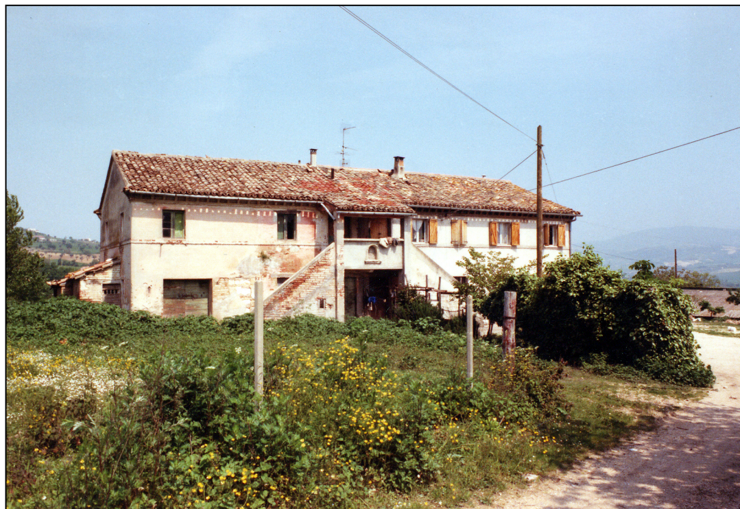
SITUAZIONE PRECEDENTE – FOTO SCHEDA ANNO 1991