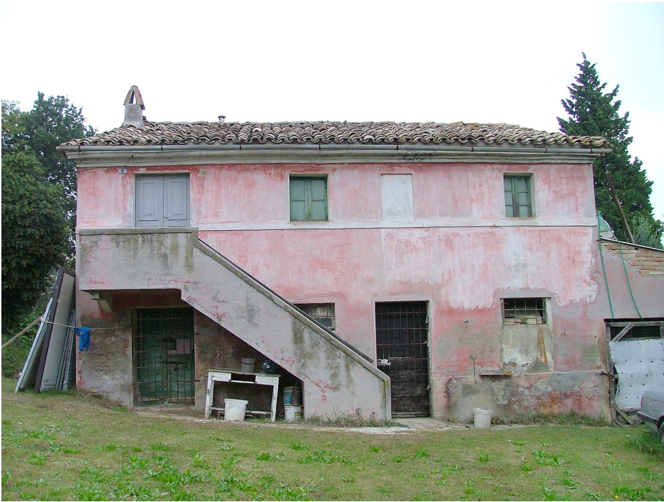
SITUAZIONE PRECEDENTE – FOTO SCHEDA ANNO 2005