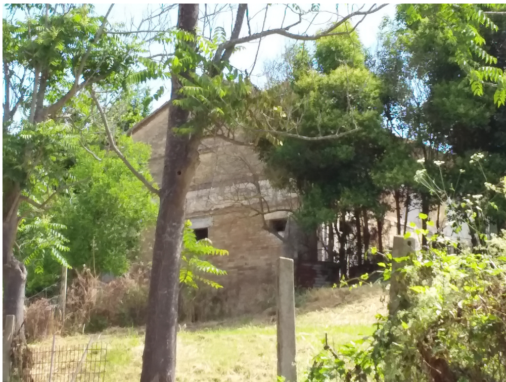
SITUAZIONE ATTUALE – FOTO ANNO 2023