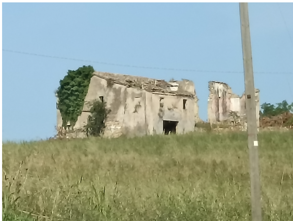
SITUAZIONE ATTUALE – FOTO ANNO 2023