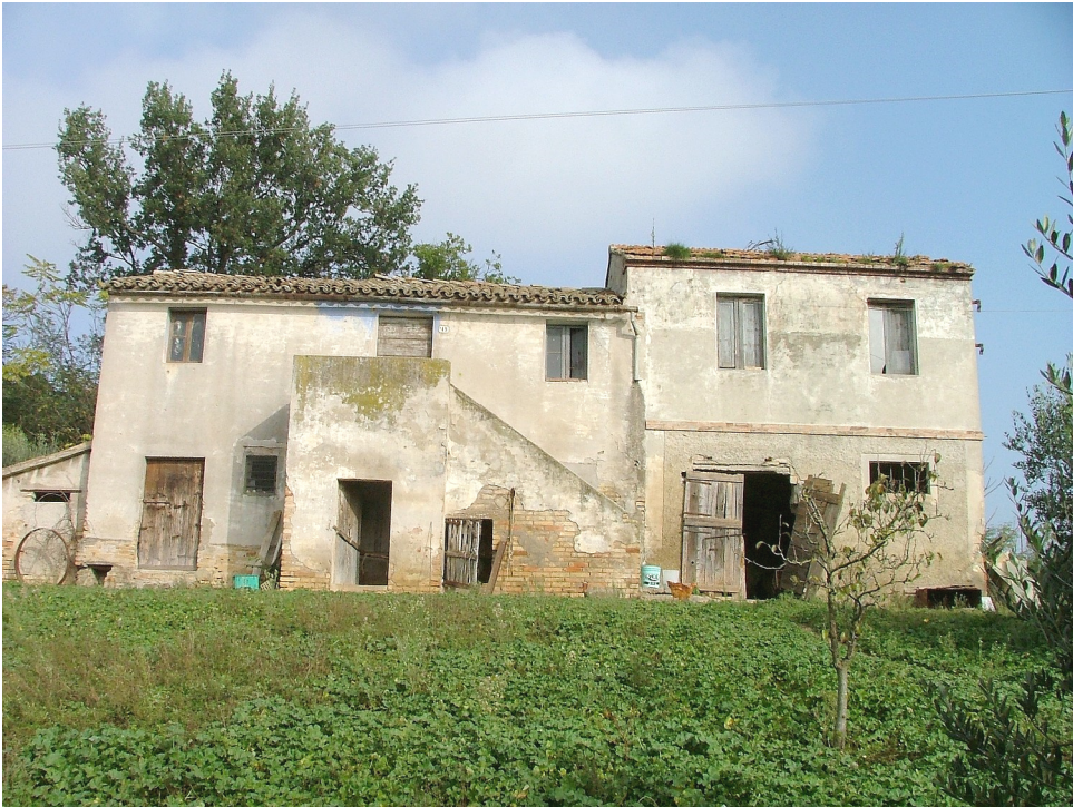
SITUAZIONE PRECEDENTE – FOTO SCHEDA ANNO 2005