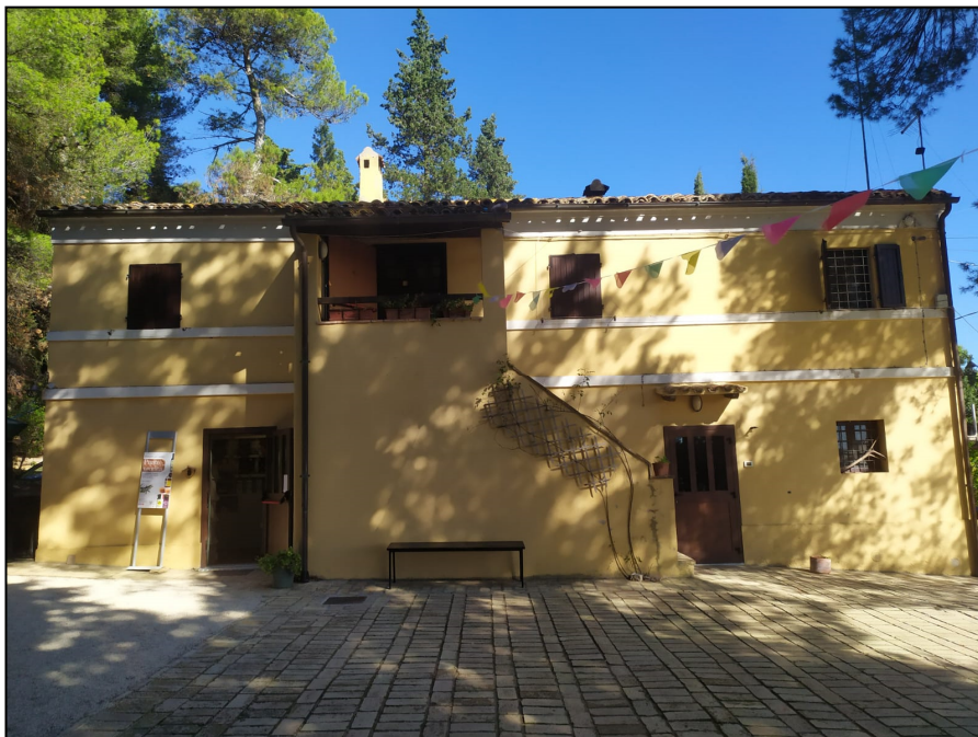
SITUAZIONE ATTUALE – FOTO ANNO 2022