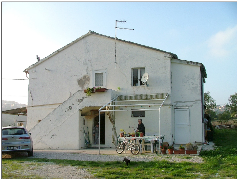
SITUAZIONE PRECEDENTE – FOTO SCHEDA ANNO 2005